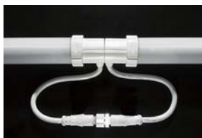
防水コネクタで連結可能